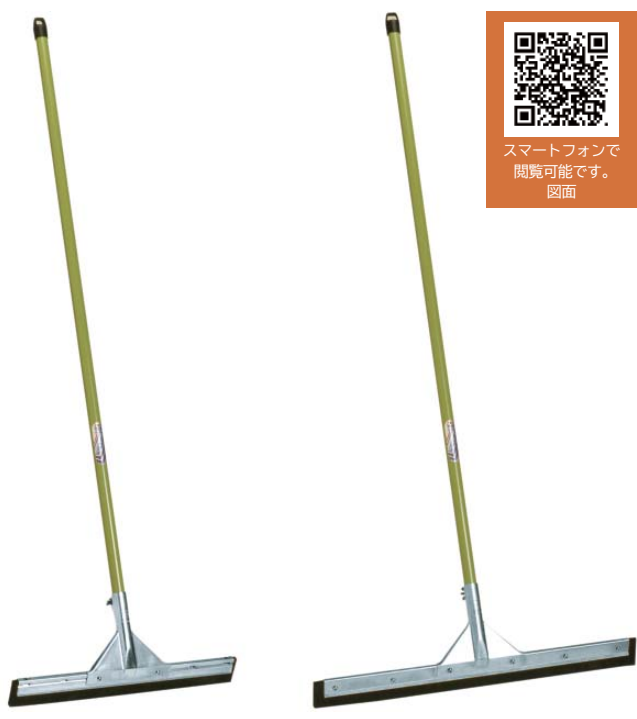
①スチール45cm 050-0010 ④スチール60cm 050-0060